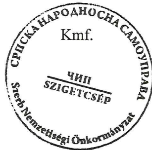
Vörös Latinka jegyzőkönyv hitelesítő